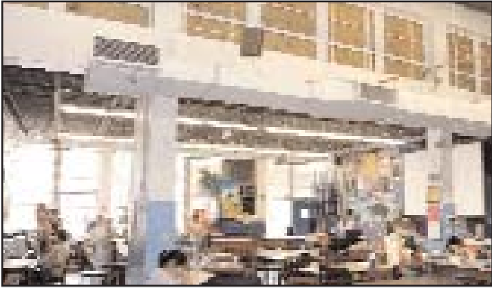
Reparación y renovación en la Escuela Secundaria McCallum

Esta edición de Fundamentos abarca las escuelas secundarias McCallum y Anderson, incluyendo sus escuelas tributarias primarias y medias.