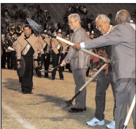
Inicio de la construcción de instalaciones atléticas en el Burger Center