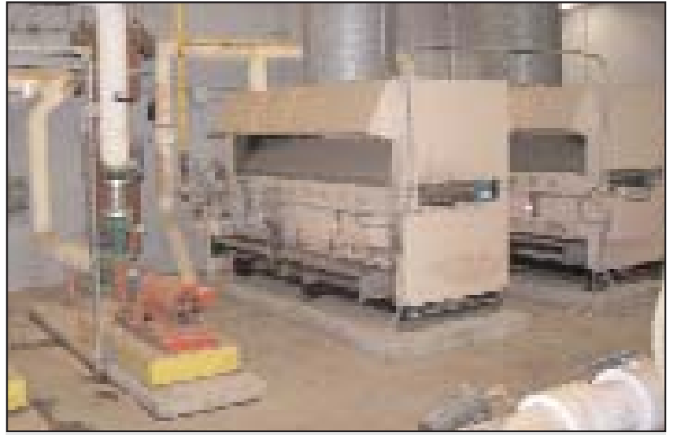
Reparación y renovación en la Escuela Secundaria Bowie

Para un listado completo de todos los proyectos de bonos de Nuestra Manzana en Acción de 2004 indicados por escuela, sírvase ir al sitio del Internet www.theappleatwork.com , o llamar al 414-BOND.