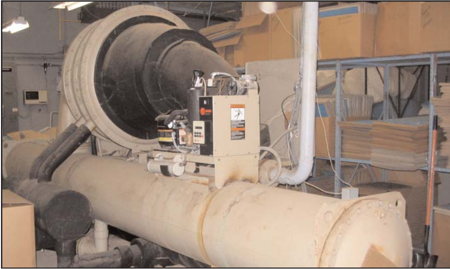
Reparación y renovación en la Escuela Secundaria Bowie

Esta edición de Fundamentos abarca las escuelas secundarias Austin y Bowie, incluyendo sus escuelas tributarias primarias y medias.